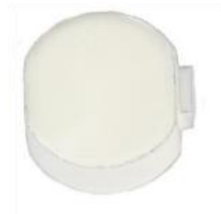
型号：G6 小尺寸耐高温标签